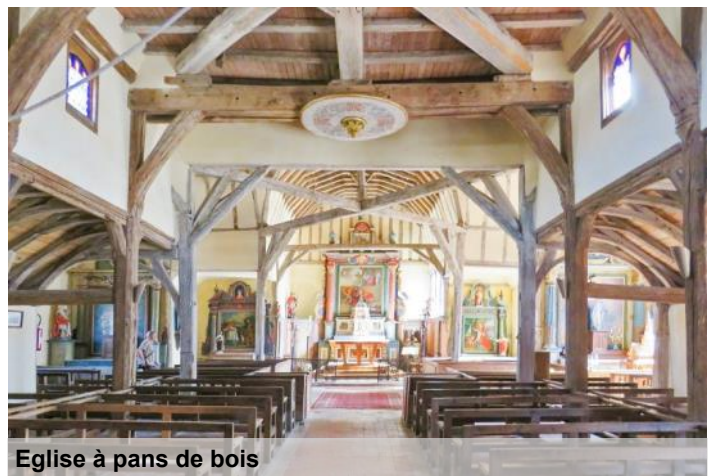
Eglise à pans de bois