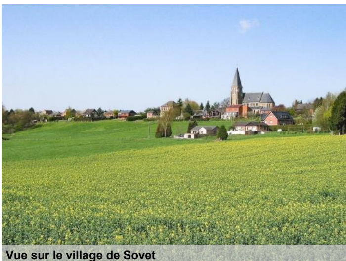
Vue sur le village de Sovet

Les dépressions et leurs versants sont occupés par l'agriculture et les prairies, les crêtes sont boisées en essences feuillues. Sans former de vastes massifs continus, les forêts y sont nombreuses.