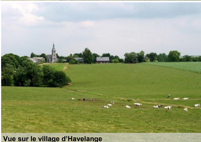
Vue sur le village d'Havelange