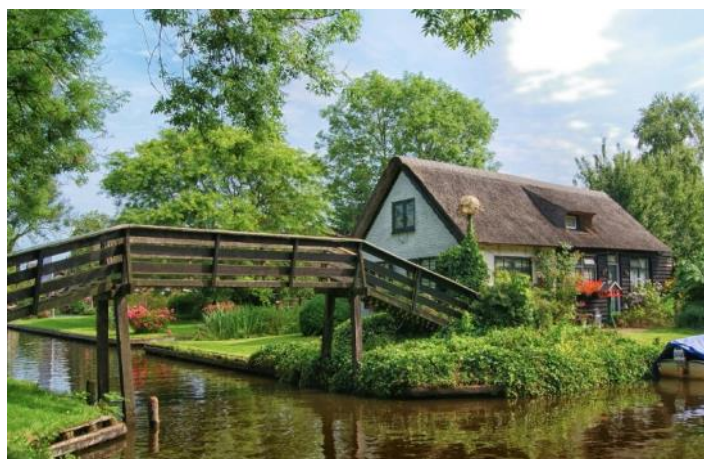
Le charme bucolique des canaux hollandais