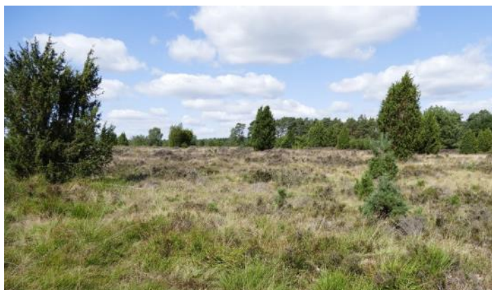
Lande de Lunebourg

Le Nord des Pays-Bas est un haut-lieu ornithologique, et le mois d'avril se prête idéalement à l'observation des oiseaux en migration. Ce séjour sera d'abord l'occasion de découvrir deux îles de la Frise , à savoir Ameland et Schiermonnikoog, et la région côtière du Lauwersmeer . Trois jours au son des vagues qui submergent les rivages, dans les embruns de l'océan.