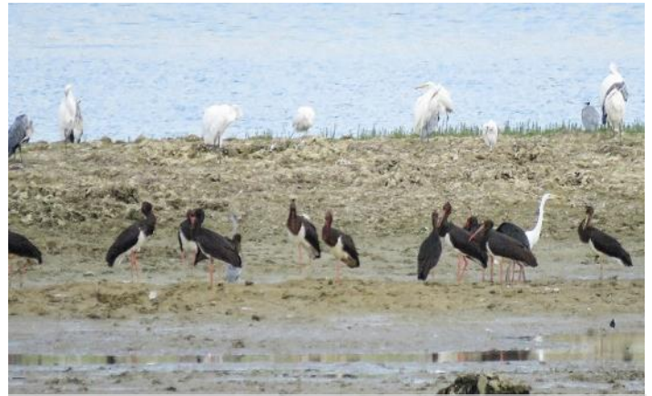
Cigognes noires et grandes Aigrettes

Danielle Maes