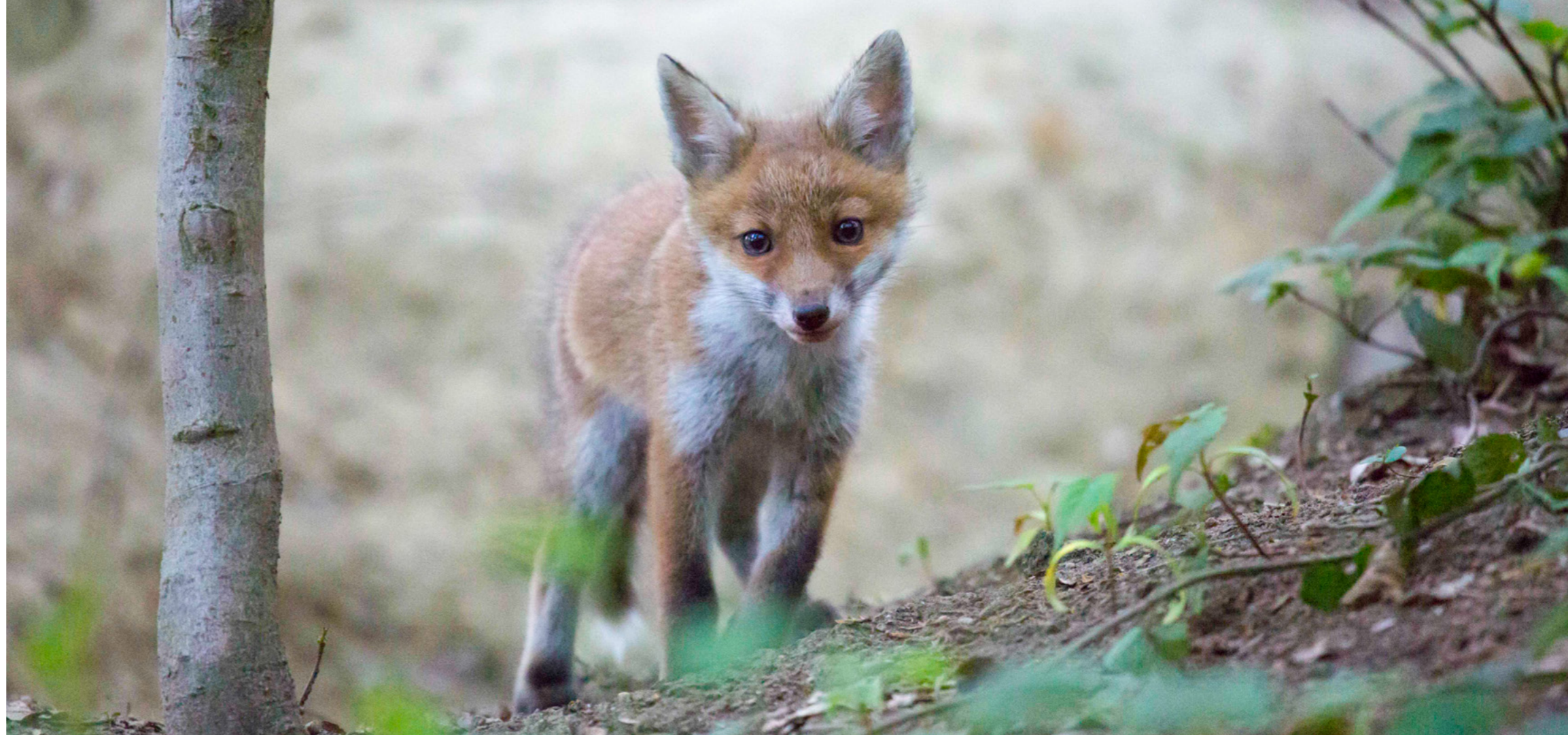
Renardeau Steven Lemaire

Après une gestation de 53 jours, la renarde met bas entre 3 et 6 petits (elle possède 8 mamelles) dans un terrier non occupé par une famille de blaireaux ou de lapins de garenne, qu'elle agrandit si besoin. À la naissance, les renardeaux pèsent 100 grammes. Ils sont aveugles et sourds. Ils sont recouverts d'un fin duvet gris foncé. Pendant les 2 premières semaines, la femelle les réchauffe constamment. Le mâle lui dépose de la nourriture à l'entrée du terrier mais n'est pas autorisé à rentrer à l'intérieur. À 4 semaines, les dents de lait apparaissent, le pelage s'éclaircit et la tête devient progressivement rousse. Ils reçoivent alors de la nourriture carnée. Ils sont allaités pendant environ 6 semaines avant d'être sevrés. À ce moment, le museau et les oreilles s'allongent et tout le pelage devient roux.