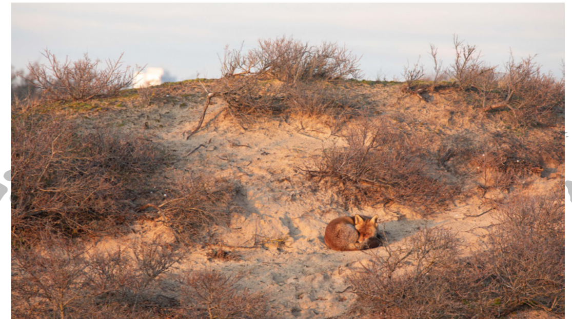
Renard dans les dunes Steven Lemaire