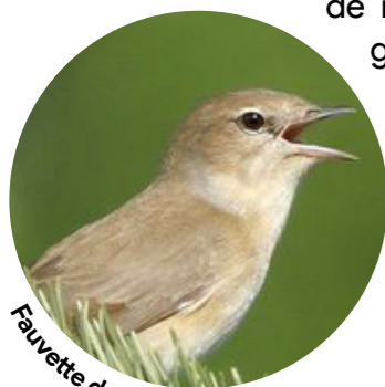
Fauvette des jardins

Bon nombre d'oiseaux y construisent leur nid pour s'y reproduire, mais elles leur servent aussi de refuge et de garde-manger. En effet, puisqu'elles servent également d'abri pour les insectes, les haies sont des endroits idéaux pour procurer de la nourriture aux oiseaux insectivores comme les fauvettes ou les pouillots.