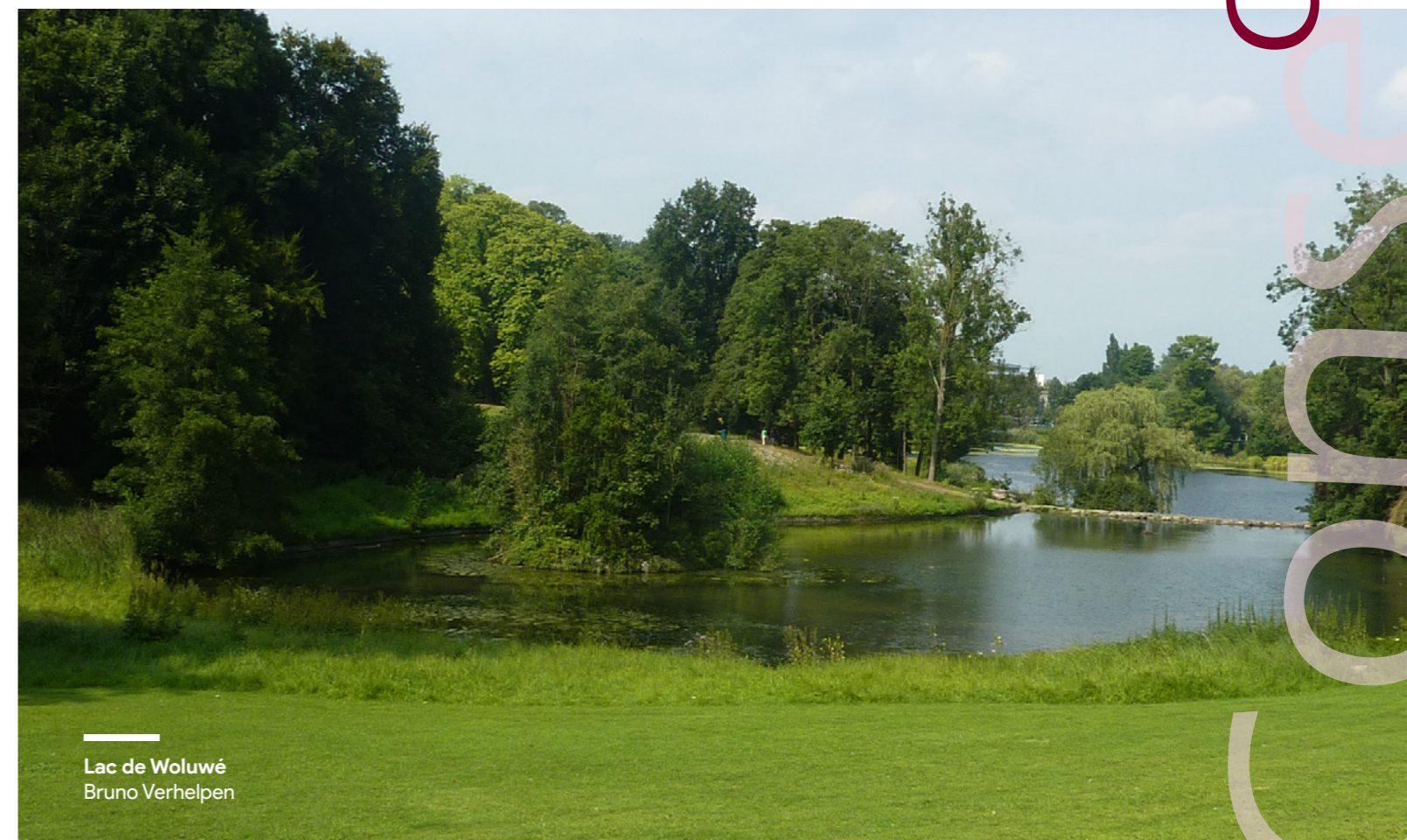
Lac de Woluwé Bruno Verhelpen

Les différentes activités proposées par Défi Nature à Bruxelles permettent également de découvrir ces différentes vallées mais sous un aspect naturaliste de biodiversité : espèces végétales caractéristiques, observation et reconnaissance des oiseaux et autres espèces animales ; parfois même sous un angle plus spécifique comme la présentation des espèces invasives occupant certaines d'entre elles. Deux approches différentes, mais très complémentaires.